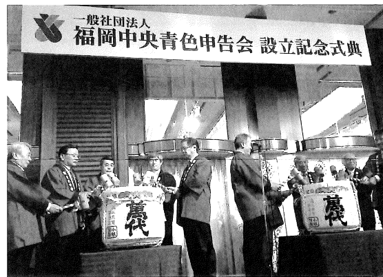
祝賀会にて鏡開きを執り行いました

今後とも会員の皆さま方とよりよい会にしていきたいと思っておりますので、何卒ご支援ご協力を賜りますよう、よろしくお願いいたします。