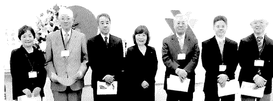
永年会員の皆さま