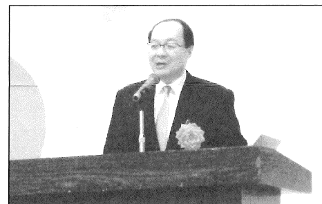
講演をされる福岡国税局 榎本直樹局長