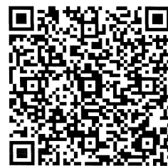
お申込み用QRコード